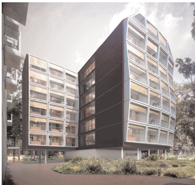
Extension de la Maison de L'Inde © Lipsky+Rollet Architectes (chantier en cours)