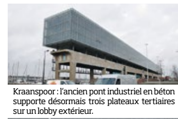
Kraanspoor : l’ancien pont industriel en béton supporte désormais trois plateaux tertiaires sur un lobby extérieur.

L’ancien chantier naval NDSM est un des plus fameux de son genre en Europe. Longtemps demeuré en friche (l’activité a cessé en1984), des collectifs d’artistes se sont emparés des lieux sous concession de la Ville à partir des années 1990 : halles et cales de construction et de mise à l’eau sont désormais le lieu d’une émulation culturelle, économique et, plus récemment, touristique. Depuis, NDSM développé l’amplitude de sa programmation urbaine : lieux de travail, de créativité et de loisirs investissent divers bâtiments rénovés et transformés en restaurants, hôtels, bureaux et ateliers. Plus loin à l’ouest, on remarque une longue barre de béton dominée par le volume, tertiaire et transparent du « Kraanspoor », projet spectaculaire et innovant de l’architecte Trude Hooykaas. ■ p. 178-79