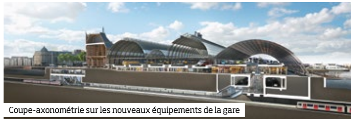
Coupe-axonométrie sur les nouveaux équipements de la gare

Parcours vers les nouveaux terrains gagnés sur d’anciens territoires portuaires, la ville repousse cette activité pour inventer un nouvel art de vivre sur cette rive de l’IJ.