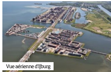
Vue aérienne d’Ijburg

Il a fallu plus de 40 ans pour dépasser les obstacles psychologiques générés par les premières idées d’extension d’Amsterdam vers l’est, mais aussi les hésitations politiques et les contraintes écologiques devenues centrales. Le début de la réalisation des îles remonte aux années 1990. Aujourd’hui, plus de 20.000 habitants occupent le site et une nouvelle île