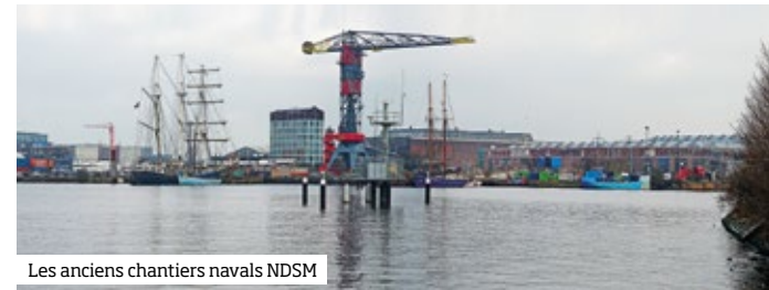
Les anciens chantiers navals NDSM