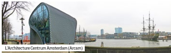
L'Architecture Centrum Amsterdam (Arcam)