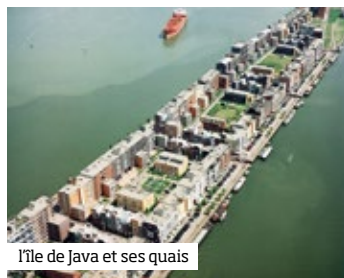
Île de Java et ses quais

A la fin des années 1980, est entreprise la mutation en quartier résidentiel des anciennes darses du port est d’Amsterdam, construites au début du 20 e siècle (Oostelijk Havengebied). Les différences entre les îles sont notables : Java avec sa grande diversité de typologies architecturales et urbaines, KNSM avec sa monumentalité, Borneo et Sporenburg (West8 urbanistes) qui semblent être composées « d’un flot de maisons ». ■ p. 130