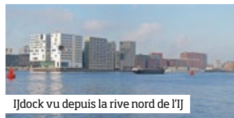
IJdock vu depuis la rive nord de l’IJ

distingue par sa proue occupée par le nouveau Palais de Justice ( arch. Felix Claus ) qui se dresse fièrement dans l’espace ouvert de l’IJ. ■ p. 142-45