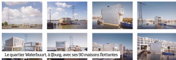
Le quartier Waterbuurt, à Ijburg, avec ses 90 maisons flottantes

Parmi la foison de projet, ce sont les maisons flottantes qui tiennent le haut de l’affiche ■ p. 136 : réponse ingénieuse au risque d’inondation, ces dernières renouvèlent le rapport des habitants à leur environnement, à l’avant-garde d’une ville lacustre maîtrisant son impact environnemental. ( arch-urb. : Marlies Rohmer ) ■ p. 136-7