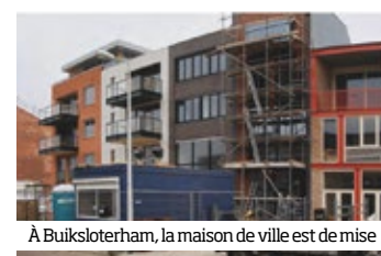
À Buikslotherham, la maison de ville est de mise

Dans cette ancienne zone industrielle liée port, la diversité des projets expérimentés se fonde sur les initiatives privées plus que sur le public : immeubles d’habitation portés par les architectes en autopromotion ou quartier de maisons individuelles où les habitants ont pu laisser libre cours à leur imagination, mutation de bâtiments industriels en surfaces partagées pour de jeunes entreprises. La foison des idées entraîne une mutation urbaine profonde et rapide sans pour autant être spectaculaire. ■ p. 174