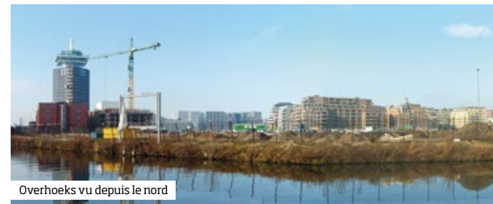
Overhoeks vu depuis le nord

Avec la Gare Centrale en vis-à-vis, « Overhoeks » profite déjà considérablement de la modernisation du transport public. De plus en plus de gens veulent y habiter et/ou travailler d’autant plus que s’y est installé le Musée de Cinéma ( EYE ) et des immeubles de logement le long l’IJ. L’ancienne Tour Shell a été réaménagé en centre de la classe créative. On dirait un nouveau monde ! ■ p. 172-73