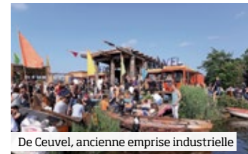
De Ceuvel, ancienne emprise industrielle

A l’entrée du quartier de Buikslotherham, le projet « De Ceuvel » régénère un ancien chantier naval lourdement pollué. Les concepteurs espèrent avoir purifié par phytoremédiation le site à l’issue de la concession de dix ans que leur a accordé la collectivité. Une ambiance qui navigue entre travail et loisir s’est installée, chacune des vieilles embarcations accueillant lieux de travail, d’expérimentation et de services. Véritable polarité aux beaux jours : le café ne désemplit pas. ■ p. 154