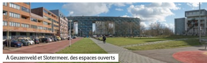
À Geuzenveld et Slotermeer, des espaces ouverts

La visite du nord de Nieuw-West permet de voir un exemple de rénovation des cités jardins de l’ouest ( Westelijke Tuinsteden ), conçus dans les années 1930 mais réalisées après-guerre, dans les années 1950 et 60. Parmi les nouvelles constructions on trouve l’immeuble « Parkrand » ( MVRDV Architectes ) ■ p. 158-61