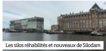
Les silos réhabilités et nouveaux de Silodam

Le vieux port du bois, maintenant bassin accueillant de nombreuses péniches habitées, se trouve dans l’ombre de deux silos historiques, réhabilités depuis une dizaine d’années en immeubles de logements ( arch. André van Stigt ). Un troisième bâtiment de logements neufs est venu former triptyque. Les architectes de MVRDV se sont clairement inspirés de ces silos pour concevoir ce qui est aujourd’hui un projet culte. ■ p. 146-47