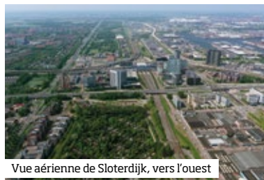
Vue aérienne de Sloterdijk, vers l’ouest

mutation, pas toujours visible : substitution d’hôtels aux bureaux, actions en bottom-up, l’urbanité advient pas à pas dans cet ancien quartier monofonctionnel. ■ p. 154