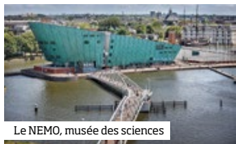
Le NEMO, musée des sciences

L’entrée du tunnel se trouve au milieu de l’Oosterdok, vieux port voisin de la Gare Centrale, et frôle l’ancienne base militaire de la marine ( Marineterrein ) ■ p.118, objet d’un « slowplanning » et actuellement envahie par les événements organisés dans le sillage de