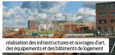
réalisation des infrastructures et ouvrages d’art, des équipements et des bâtiments de logement

Le nouveau projet fait face au Spaarndammerbuurt, quartier célèbre pour son architecture de l’Ecole d’Amsterdam mais relativement oublié durant les 25 dernières années. Houthavens s’installe sur les darses existantes qu’il complète de nouvelles surfaces accueillant principalement une programmation résidentielle. La clef du projet réside dans le parc qui jouera l’articulation entre le Ppaarndammerbuurt et le nouveau quartier, rendu possible par l’enfouissement en tunnel des actuelles voies automobiles longeant la rive. Une tour surnommée « Golden Gate » ( arch. Arons et Gelauff ) parachèvera ce nouveau quartier qu’elle dominera du haut de ses 25 étages. ■ p. 148