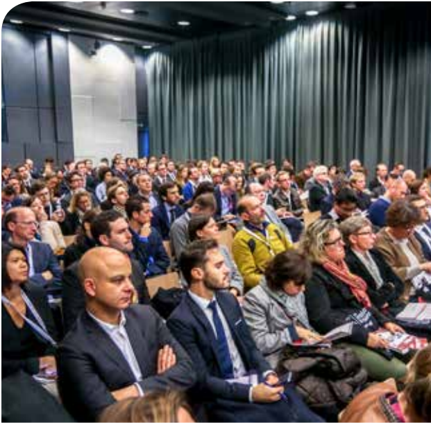
Table ronde L'urbanisme éphémère, outil d'urbanisme ou effet de mode ?

Les initiatives en matière d'urbanisme « éphémère » ou « temporaire » se multiplient, et l'on dispose aujourd'hui d'un certain recul sur ces opérations. Moyen d'occuper un site en amont de l'aménagement, de l'animer, d'associer la population, de développer de nouveaux usages, voire de nourrir le projet urbain à venir, l'urbanisme éphémère peut-il être considéré comme un véritable outil, ou bien ne faut-il toujours y voir qu'un effet de mode ?